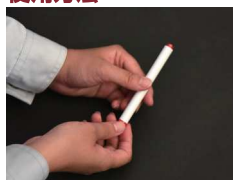
尾栓を回転させると